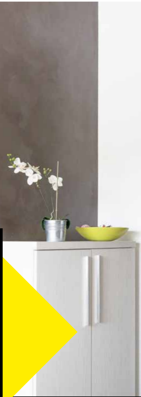
Magic Space® armario - puerta simple.

Una solución personalizada con un diseño inconfundible!