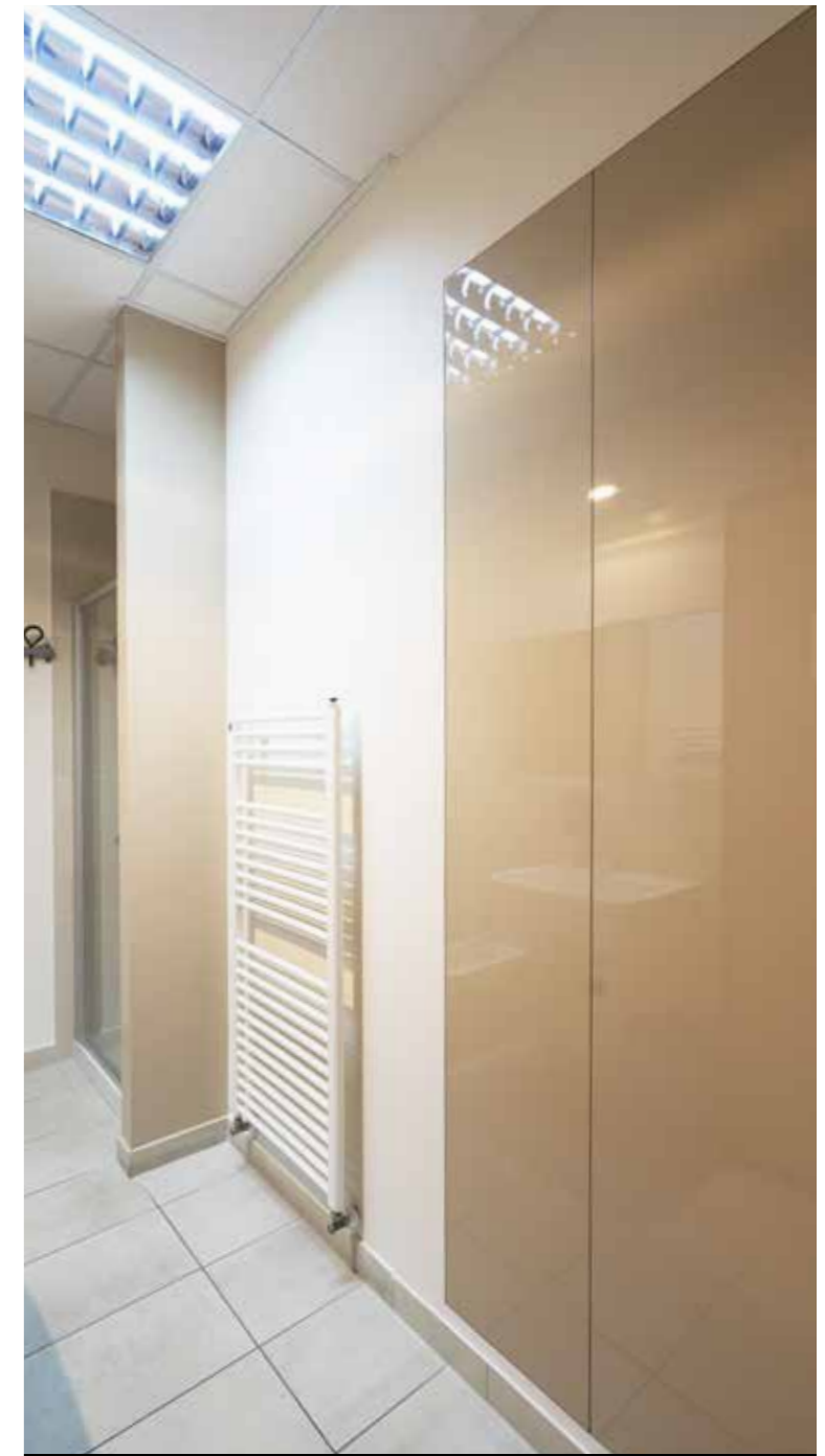
Magic Space® lacado brillante armario todo uso - puerta doble.