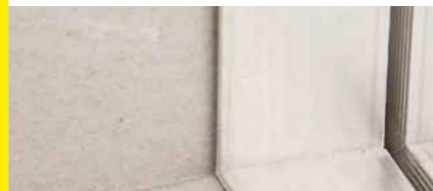
Primer detalle "board hide"

1 Atornillar la estructura metálica al marco Magic Space® con tornillos autoperforantes.