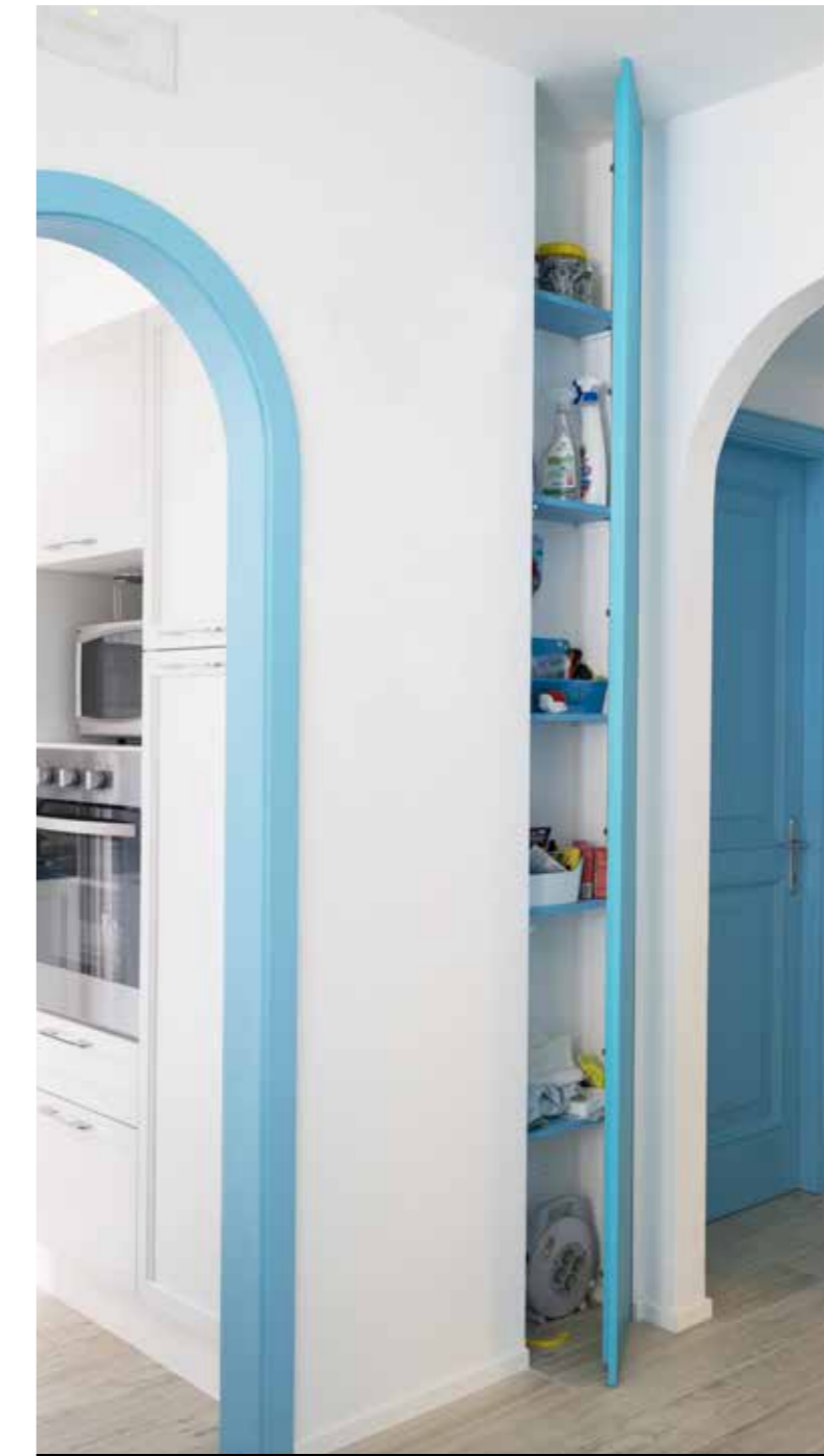
Magic Space® lacado satinado armario todo uso - puerta simple.