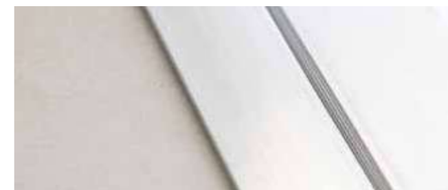
Segundo detalle "board hide"

2 Creación de la caja posterior. Las placas se insertan en el asiento apropiado "board hide" (detalle primero y segundo) del marco y atornillados sólo cerca de la parte inferior de la caja.