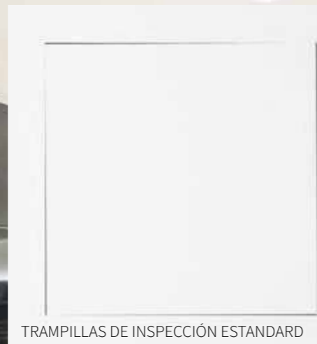
TRAMPILLAS DE INSPECCIÓN ESTANDARD

Las trampillas de inspección tradicionales deben instalarse por separado, o sea primeramente se fija el marco y luego se instala la puerta, si el aplicador no pone suficiente atención se puede presentar el problema antiestético del no alineamiento, o sea que la trampilla no se centrará en su sede. Además, las pesadas estucadura en la puerta arruinan muy a menudo el ángulo de los bordes.