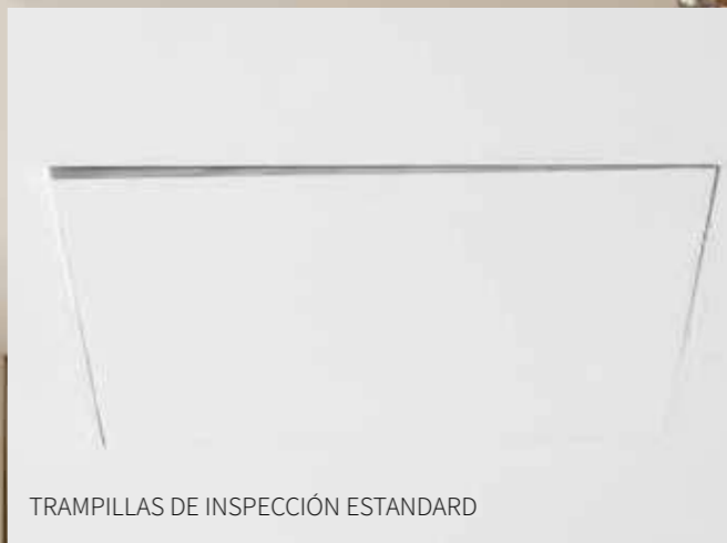
TRAMPILLAS DE INSPECCIÓN ESTANDARD

Las trampillas de inspección estándar tienen sistemas de cierre fijados en el marco por medio de componentes independientes, si se necesita un poco de variación del ángulo durante el transporte, el montaje o la apertura y cierre para el uso normal, la puerta no estará más en línea con las placas de yeso.