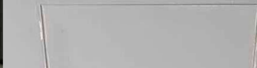
TRAMPILLAS DE INSPECCIÓN ESTANDARD

El problema estético más grande de las trampillas de inspección tradicionales son las hilaturas, pocas horas después de la instalación o en la mayoría después de unas semanas, casi todas las trampillas tienen grietas en los bordes del marco y de la puerta, de manera que el aluminio subyacente aparece destruyendo irreversiblemente la estética de todo.